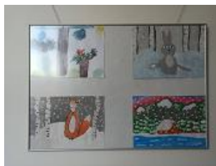
Lesy a příroda kolem nás