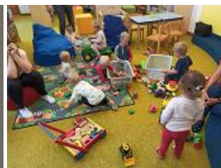
Batoláci v knihovně