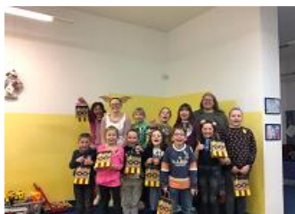
Noc s Andersenem